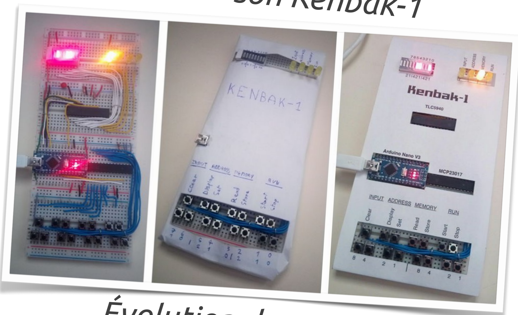
Évolution du prototype

La réplique est réalisée avec des composants modernes , réduisant le coût, la taille et le poids de l'appareil.